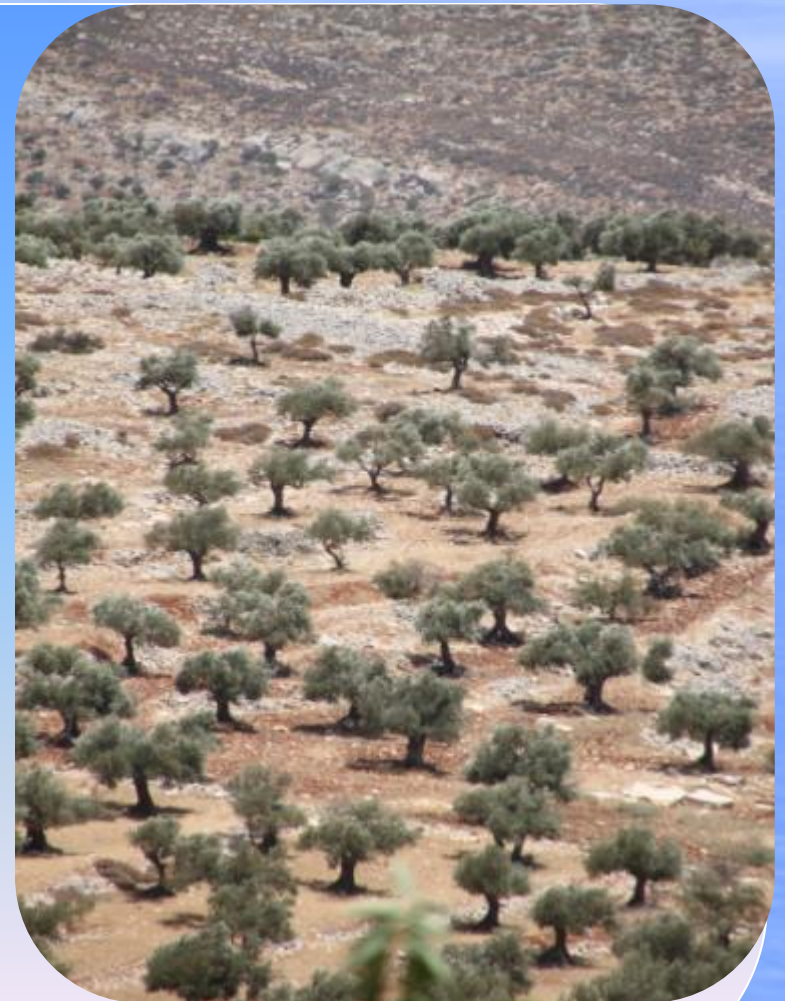
Die Friedensbäume um Taybeh im Heiligen Land. Dort gepflanzt mit der christlichen Gemeinde.